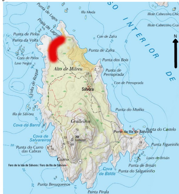
Figura 1: Mapa de la isla de Sálvora (Ribeira, La Coruña), (Fuente: Iberpix). La mancha roja es donde se realizaron los muestreos.

En la Capelada habita entre varios tipos de comunidades en los que está presente Plantago sp. Observamos un gradiente en su zona de campeo, desde más cerca de la costa, la asociación Crithmo maritimi-Plantaginietum maritimæ Guinea 1949, pasando por las formaciones del Echio plantaginei-Galactition tomentosæ O. Boldòs & Molinier 1969, llegando a los pastizales de Stellarietea mediae Tüxen, Lohmeyer & Preising ex von Rochow 1951, y, más arriba, de Plantaginietalia majoris Tüxen & Preising in Tüxen 1950. Algunas de ellas se entremezclan en 1/4 ha sobre una terraza solifluxionada producto de un deslizamiento de material del acantilado inmediato superior. Se trata de un pastizal húmedo de 100 % de cobertura de difícil adscripción por su heterogeneidad. Estas terrazas las corta el mar y las va deshaciendo con los temporales. Son formaciones geomorfológicas que se pueden ver con relativa facilidad en ciertas partes de la costa de la Capelada.