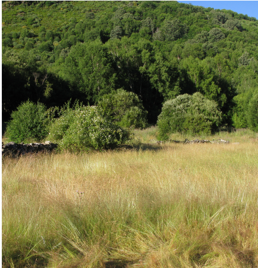
Figura 1: Vista parcial del prado en el que apareció el ejemplar de Euchalcia variabilis (Piller & Mitterpacher, 1783), Ponte (A Veiga, Orense).

Según diversos autores la larva se alimenta de Aconitum , Delphinium , Consolida o Thalictrum . Igual que para la especie antedicha, P. moneta , se estudió el acónito de Trevinca y las citas gallegas de todas las especies (Véase Pino, 2016: 3 [8]), sin resultado. Aunque en el municipio de A Veiga no se ha citado ninguna especie de Thalictrum , y solo una se ha recogido en Trevinca ( Thalictrum minus L. subsp. minus : FGV 6890 (=LOU 48249)), hay al menos cinco especies citadas de Galicia y en no pocas ocasiones, alguna de ellas, de las montañas orientales y sus alrededores (Valga como ejemplo una publicación por cada una. Thalictrum flavum L.: LOU 51, Merino, 1905: 167 [7]; Thalictrum glaucum Desf.: Lange, 1865: 248 [6]; Thalictrum minus L.: Giménez et al. , 1991: 142 [4]; Thalictrum speciosissimum L.: LOU 30568! Camaño et al. , 2008: 21 [2]; Thalictrum tuberosum L.: Rivas, 1899: 102 [9]).