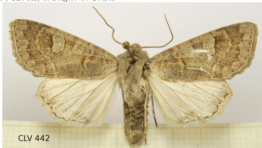
Figure 1: Habitus de Ammoconia caecimacula ([Denis & Schiffermüller], 1775), ♂, CLV442, de Folgoso do Courel.

En Ronkay et al. (2001: 180 [11]), se mencionan varias plantas bajas como alimentos de la larva, de las cuales se han citado en la bibliografía del Courel o bien se han estudiado: Rumex acetosa (Merino, 1906: 553 [8]); R. acetosella (Amigo, 1984: 231 [1]); R. obtusifolius (Merino, 1902: 372 [6]). Silene scabriflora subsp. megacalycina (FGV 1319! [=LOU 41616]); S. legionensis (FGV 1261! [=LOU 41551]); S. gallica (Merino, 1902: 372); S. scabriflora (Giménez de Azcárate & Amigo, 1996: 137 [4]); S. nutans (LOU 29908!, Caamaño, 2006: 122 [3]). Taraxacum pinto-silvae y T. sundbergii (Pino et al. , 2011: 76 [10]). Stellaria nemorum (Merino, 1905: 232 [7]), subsp. montana (FGV 1458! [=LOU 41786]). Galium odoratum (FGV 7415 [=LOU 48842]); Galium rotundifolium (FGV 7468 [=LOU 48913]); Galium lucidum y varias especies más del género (Giménez de Azcárate & Amigo, 1996: 71 [4]); G. estebani (FGV 7461 [=LOU 48903]). O la abundante Digitalis purpurea subsp. purpurea que señalan Giménez de Azcárate & Amigo (1996: 223 [4]).