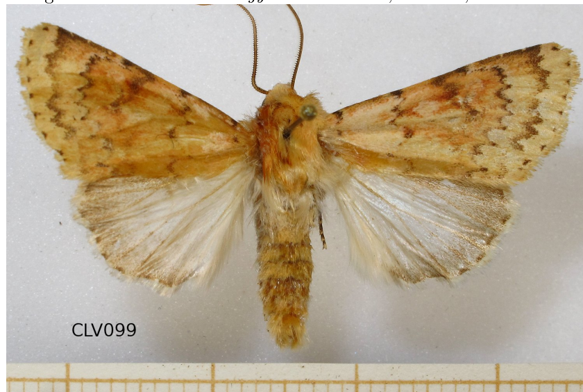
Figura 1: Habitus de Dichagyris constanti ♂, CLV099, de Trevinca

Orense, Rubiá, Pardollán, A Fraga, 29TPH7852202576, (mapa 4), 548 m, 4 ♂, AMF1318-1321, 05/10/2007, leg. A. Martínez Fernández .